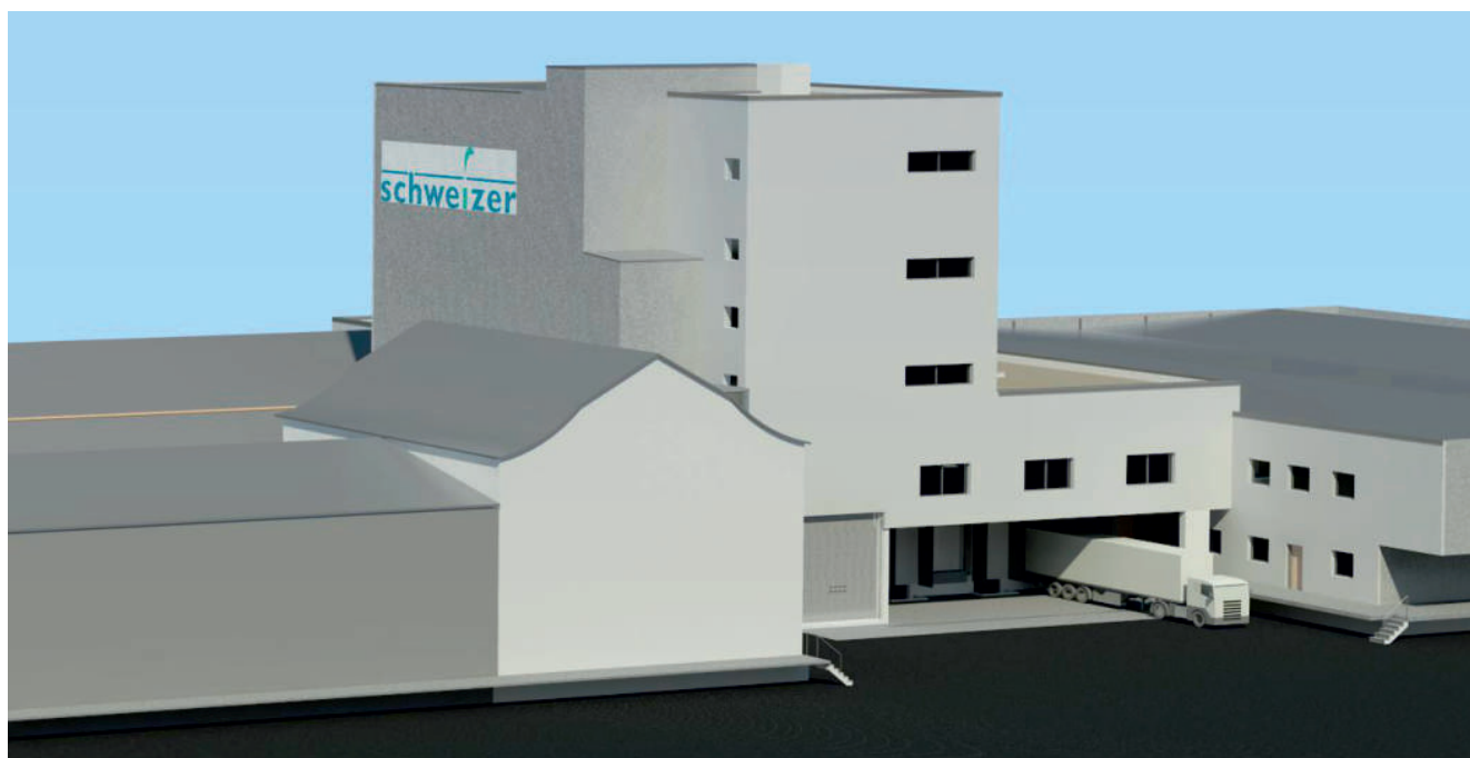
Der Neubau «Turm» für neue Produktions- und Verpackungsanlagen als 3D-Projektstudie.

Dank guter Vorplanung und der Flexibilität aller Projektbeteiligten konnte während der gesamten Bauzeit die Produktion aufrechterhalten werden.