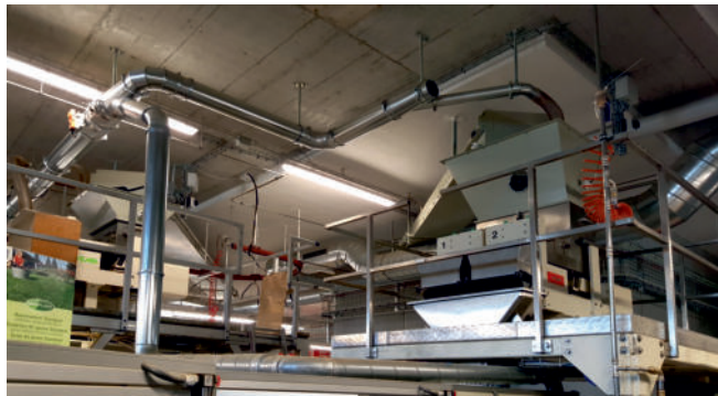
Optimierte Aufstellung der Dosier- und Abfüllanlagen.

Aufgrund der ausgeprägten Saisonalität des Sämereingeschäfts stand für die Realisierung nur eine sehr kurze Bauzeit zur Verfügung. In enger Zusammenarbeit mit den Verantwortlichen der Eric Schweizer AG wurde in einer intensiven Umsetzungsphase von nur 10 Monaten das Investitionsvolumen ausgeschrieben, vergeben und verbaut.