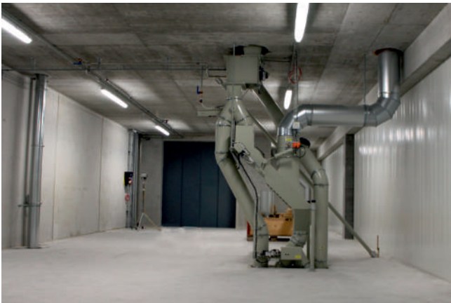
Effiziente Getreidereinigungs- und Förderanlagen.

Rechtzeitig zu Beginn der Hochsaison waren die neuen Produktionsanlagen betriebsbereit und die Eric Schweizer AG konnte zusammen mit ihrem 175-jährigen Jubiläum auch die Eröffnung des neuen Produktionsgebäudes feiern.