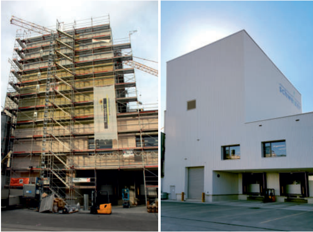
Der in die bestehend Gebäudestruktur integrierte Neubau «Turm».