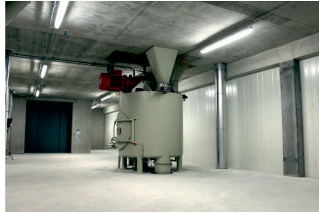
Moderner Mischer mit Platzreserve für 2. Linie.